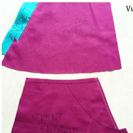
Vue fin étape 3/assemblage patte et parement